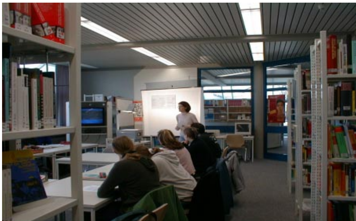
Schülerinnen und Schüler präsentieren ihre Projektergebnisse

Schulbibliothek: Wir haben die ASB, die „ Allgemeine Systematik für Bibliotheken “ in der normalen Version für Öffentliche Bibliotheken, nicht in der Schulversion. Leider ist die ASB inhaltlich veraltet und Zuordnungen neuer Gebiete oft sehr schwierig. Seit kurzem ist ja die Neufassung der ASB von 1999 auf dem Markt und wir haben ein Exemplar gekauft, aber natürlich noch keine Möglichkeit gehabt, irgendetwas zu überarbeiten und umzusystematisieren. Ich frage mich überhaupt: Wer soll die vorhandenen 13.000 Titel auf die neue richtige systematische Zuordnung durchsehen