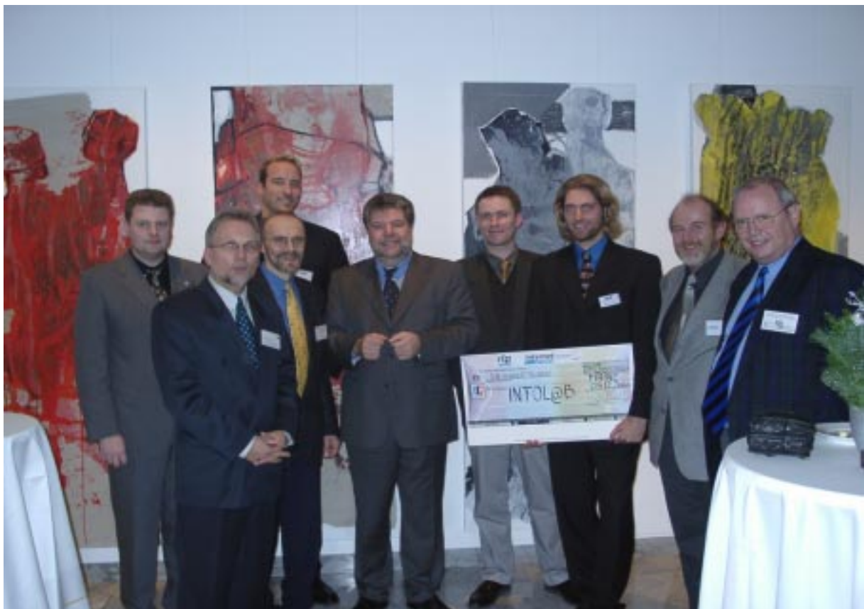
Die Konsortialpartner des Bibliotheksprojektes INFOL@B bei der Preisverleihung des Multimedia-Wettbewerbs des Landes Rheinland-Pfalz am 5.12.2000 mit Ministerpräsident Kurt Beck (Bildmitte) in der Staatskanzlei in Mainz.